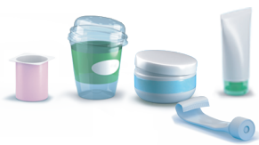
Potjes en tubes